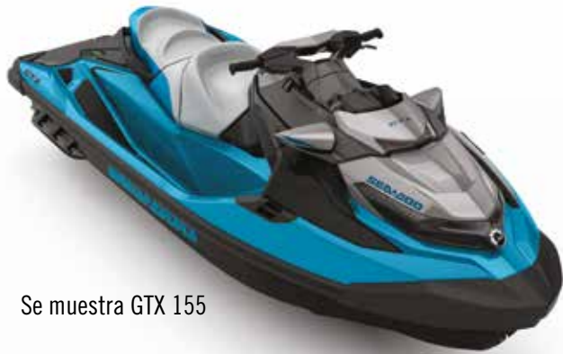
Se muestra GTX 155