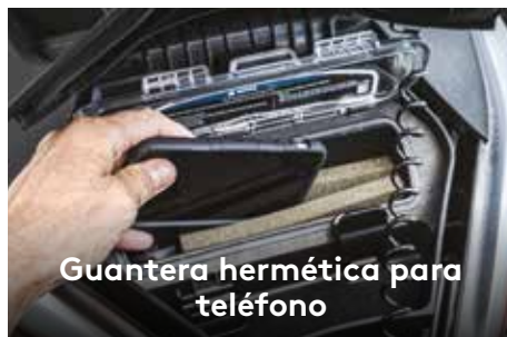
Guantera hermética para teléfono

El motor Rotax® 1503 NA ofrece una aceleración instantánea para disfrutar de una diversión inmediata, mientras que el motor 1500 HO ACE™ viene con un potente sobrealimentador e incluye la tecnología de eficiencia de combustión avanzada (ACE).