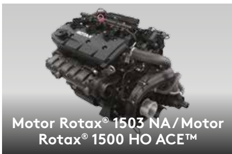
Motor Rotax® 1503 NA / Motor Rotax® 1500 HO ACE™

El primer sistema de audio de la industria instalado de fábrica, Bluetooth ‡ , totalmente resistente al agua. 2