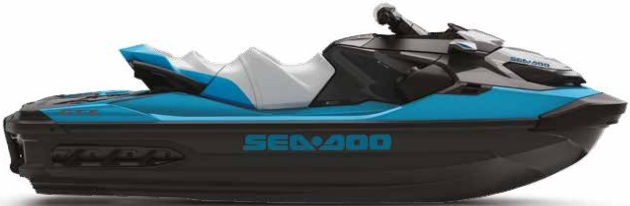
Se muestra GTX 230