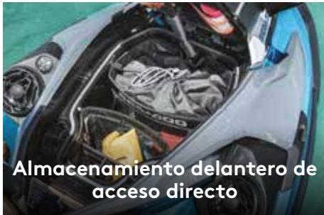
Almacenamiento delantero de acceso directo

El amplio almacenamiento delantero es fácilmente accesible desde el asiento. 1