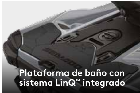
Plataforma de baño con sistema LinQ™ integrado

El amplio almacenamiento delantero es fácilmente accesible desde el asiento. 1