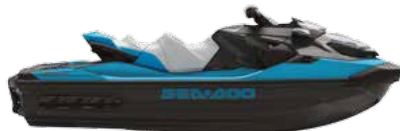
Beach Blue Metallic y Lava Grey