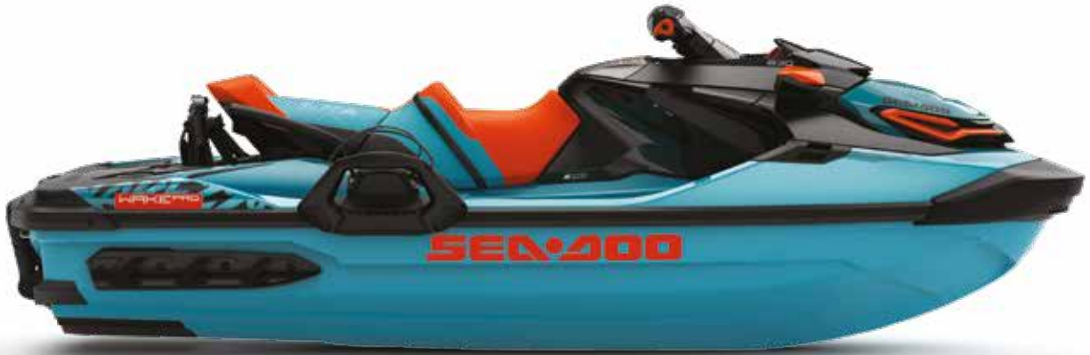
Se muestra WAKE PRO 230