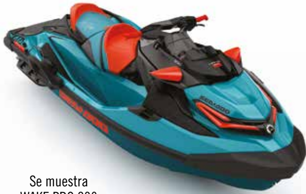
Se muestra WAKE PRO 230