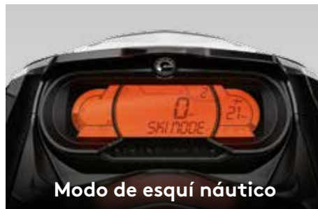
Modo de esquí náutico

Facilita el transporte de la tabla de wakeboard. 3