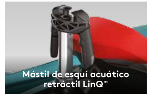
Mástil de esquí acuático retráctil LinQ™

El primer sistema de audio de la industria instalado de fábrica, Bluetooth 2 , totalmente resistente al agua. 2