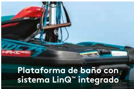
Plataforma de baño con sistema LinQ™ integrado

Exclusivo sistema de conexión rápida en la plataforma de baño más amplia del sector que facilita la instalación de accesorios de almacenamiento. 1